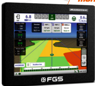
Monitor de siembra opcional